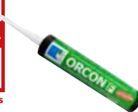
ORCON F Para uniones con elementos constructivos colindantes